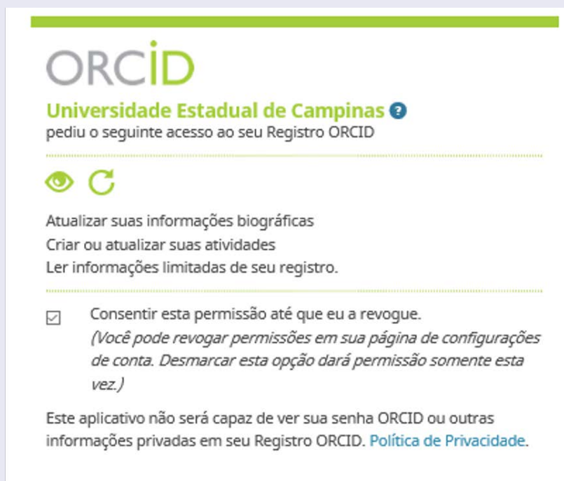
Figura 1 – Consentimento de acesso à conta pela UNICAMP